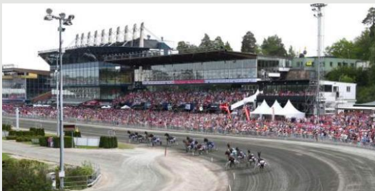
Solvalla, le temple du trot suédois

Femelles de 4 ans : Super Gotaland (Nordique) a notre préférence devant Xindra (In Dial Deum), très combattive. Attention également à Mellby Towns (Lebouc) malgré son 10, elle reste sur une belle 4 ème place lors de la finale Breeder's Crown ! On complète notre sélection par Fasty Lulu Diamond (Origami), qui part avec le 9 mais pourrait bien se qualifier.